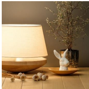
Kjell (ab € 600,-)