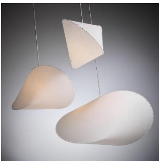
Floyd (ab € 484,-)