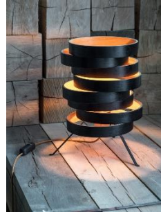
Cloq (ab € 654,-)