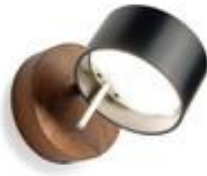
Frits pur (ab € 473,-)