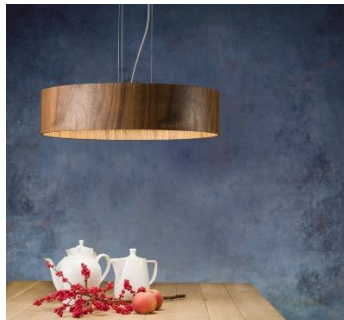
Lara wood (ab € 902,-)