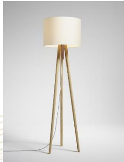
Sten Linum (ab € 902,-)