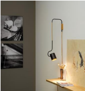
Bocal (ab € 523,-)