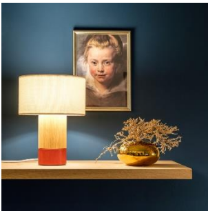
Klippa (ab € 493,-)